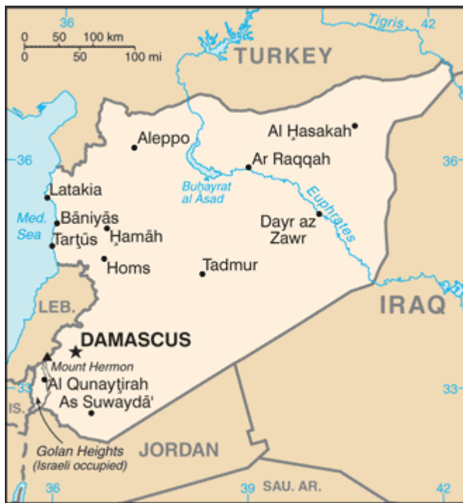
Ilustración 1: Mapa de Siria: CIA World Factbook, 2012.

Se encuentra en el continente asiático, al Este del mar Mediterráneo. Hace frontera con el mar Mediterráneo por el Oeste, con Líbano por el Suroeste, Palestina y Jordania por el Sur, Irak por el Este y Turquía al Norte.