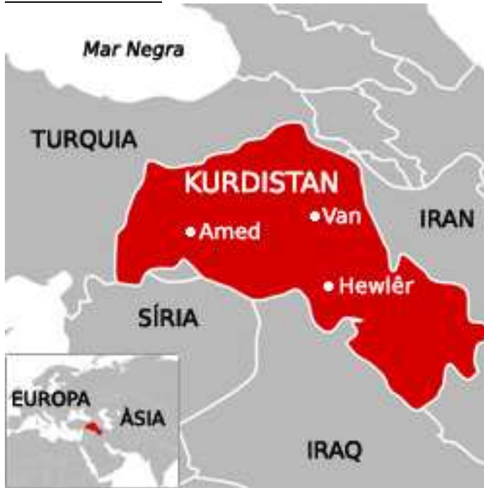
Ilustración 2: Mapa del Kurdistán, MónDivers, 2012.

Se encuentra en el continente asiático, en la península de Anatolia. En la actualidad su territorio está dividido entre Irak, Turquía, Siria e Irán.